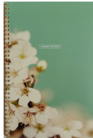
Carnet de bord